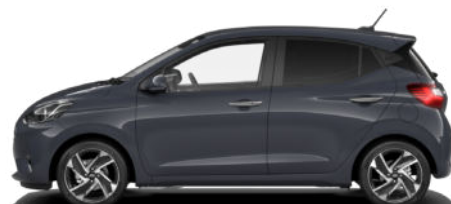
Aurora Gray Pearl