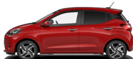
Dragon Red Pearl Kontrastdach verfügbar