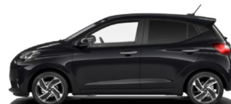
Phantom Black Pearl