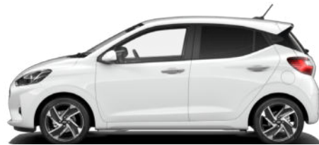
Atlas White Kontrastdach verfügbar