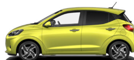
Lucid Lime Metallic Kontrastdach verfügbar