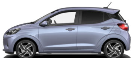
Meta Blue Pearl Kontrastdach verfügbar nicht für N Line