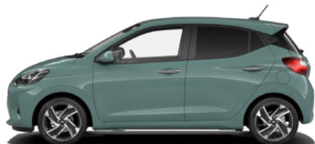
Mangrove Green Pearl Kontrastdach verfügbar