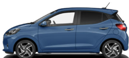
Vibrant Blue Pearl Kontrastdach verfügbar