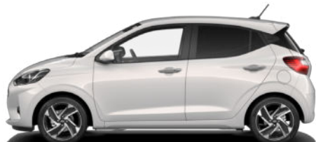
Lumen Gray Pearl Kontrastdach verfügbar